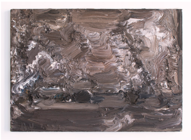
Stilvenen , Olieverf op linnen, 2004, 65 x 92 cm