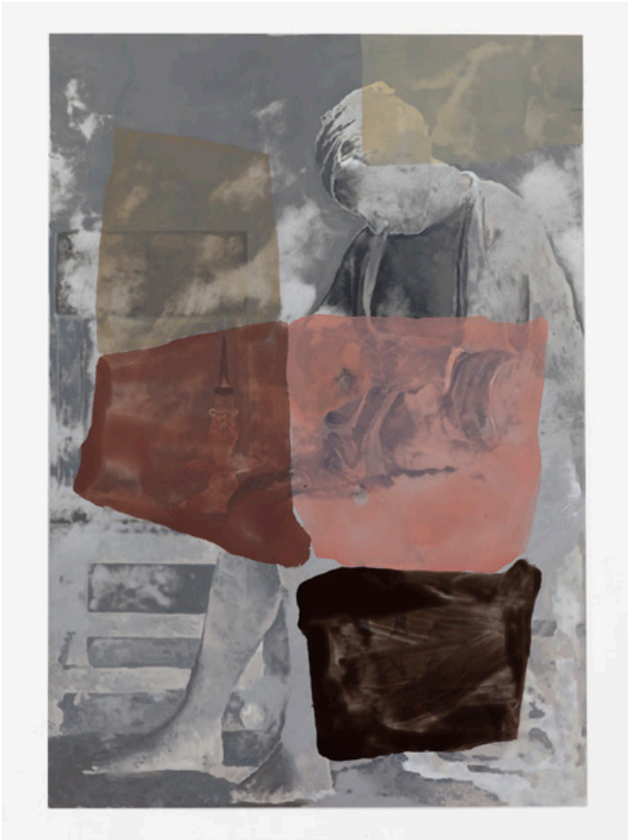
pilgrim pain , Olieverf op aluminium, 2019, 125,2 x 87 x 3 cm