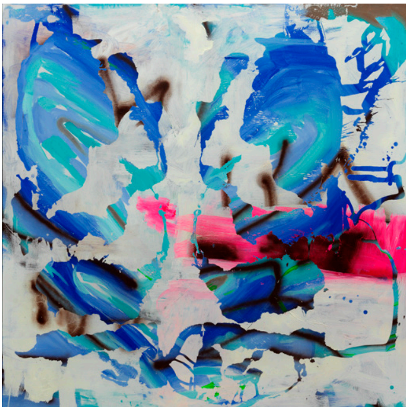
Kiral 1 , Acrylverf op canvas, 2019, 150 x 150 cm