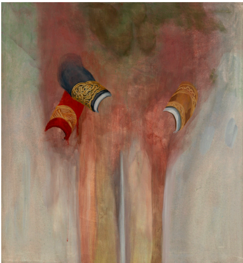
Generaal , Eitempera op canvas, 2018, 100 x 94 cm