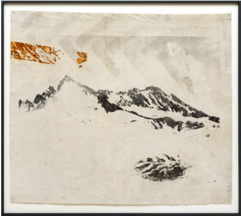
Piz Jeremias (uit de serie Monuments) , Lithografie op gebruikt geotextiel, 2019, 113 x 130 cm