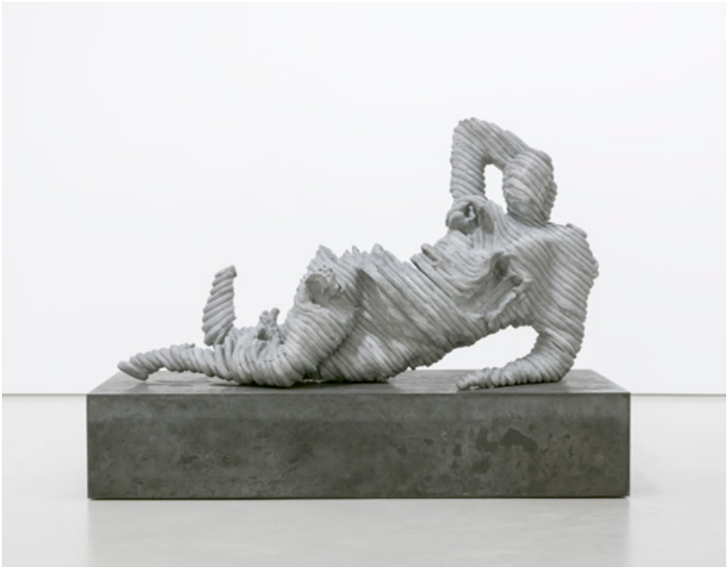
Self-portrait as reclining nude II , Aluminium, 2017, 85 x 153 x 57 cm