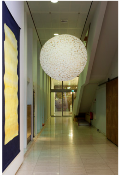
Cappucino / Rice Cracker , Styrofoam, fiberglass, epoxy, hars en acrylverf, 2017, Diameter 145 cm