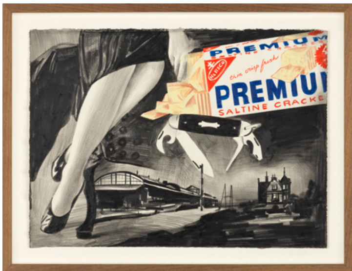
Z.t., Potlood op papier, 2017, 28 x 38 cm

De laatste jaren is Van Eeden een andere weg ingeslagen. Hij blijft werken met potlood op papier maar naast het zwart hanteert hij nu potloden in alle kleuren van de regenboog. Karakteristiek voor zijn recente werken is de verscheidenheid aan bijzonder felle kleuren.