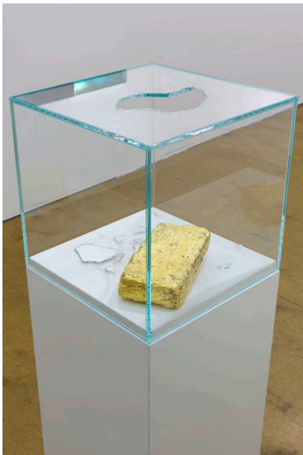
For James and Jimmie , Baksteen, bladgoud, verbrijzeld glas en scherven, 2019 130 x 30 x 30 cm