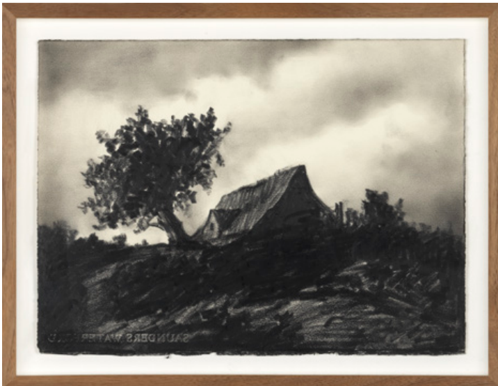
Z.t., Potlood op papier, 2013, 28 x 38 cm

Van Eeden laat zich inspireren door foto's en afbeeldingen uit oude boeken en tijdschriften. Hij gebruikt de foto's als uitgangspunt om zijn eigen verhaal te creëren. Hij voegt nooit iets toe, maar laat eerder elementen weg. De artistieke kwaliteit van de foto's die hij gebruikt, hoeft van hem niet hoog te zijn. Over professionele foto's zegt hij: "Die zijn af, daar kan ik niets meer mee."