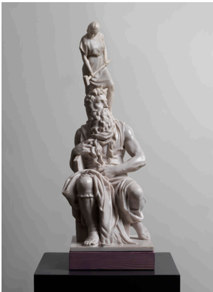
Habla , Kunstmarmor, 2019, 153,5 x 20 x 19 cm