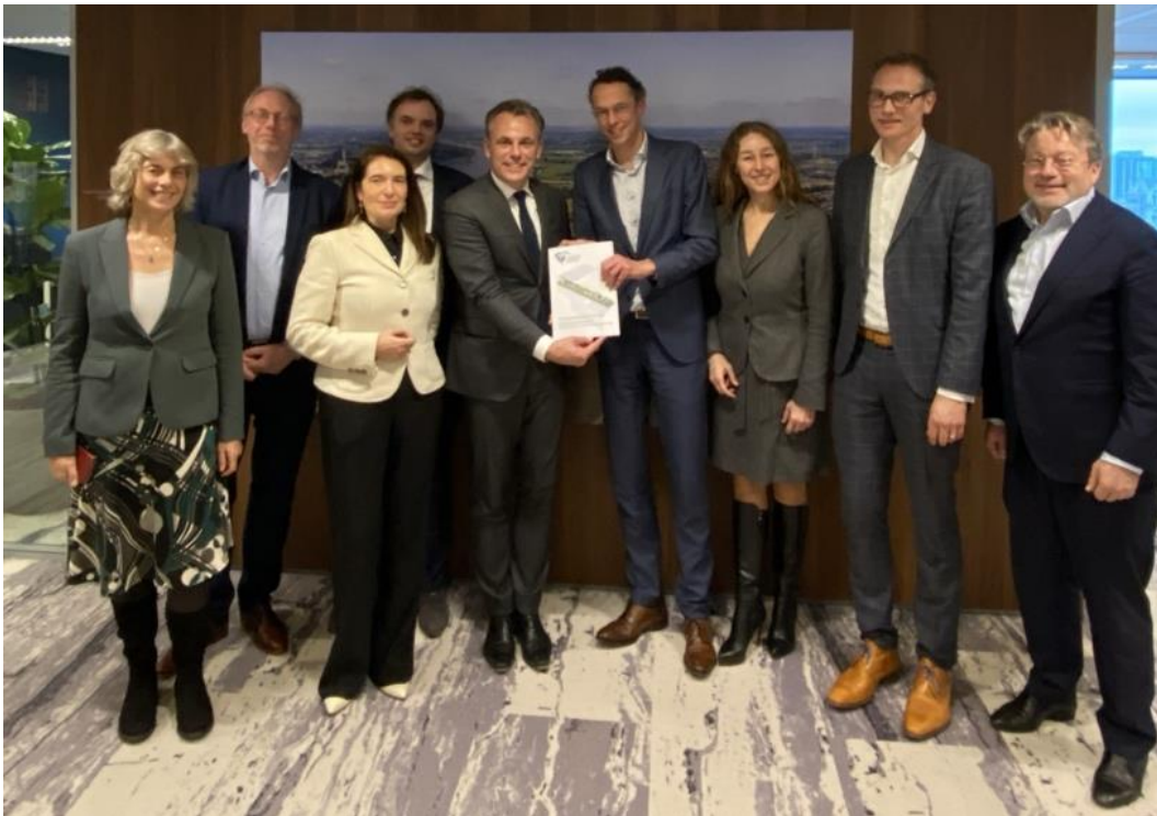
Overhandiging rapport 'Klimaatadaptatie in een stroomversnelling' door Werkgroep Klimaatadaptatie van het Platform voor Duurzame Financiering aan demissionair minister Harbers, december 2023.

In dit voortgangsrapport beschrijven we de activiteiten en resultaten per cluster en per aanbeveling (uit het rapport) binnen dat cluster. Ook vind je informatie over de start van twee pilots: Funderingsaanpak Bloemhof Rotterdam en Klimaatadaptieve bedrijventerreinen Súdwest Fryslân. Per cluster geven we ook inzicht in de plannen voor 2025 en 2026. We sluiten af met een tijdlijn en de samenhang met andere initiatieven waar we mee samen werken.