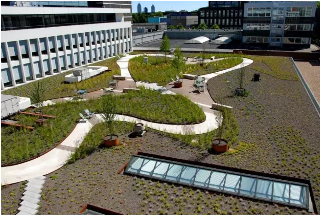
Multifunctioneel dak op de Zuid-As met polderfunctie (watersturing).

In het rapport is beschreven dat beleggingen in klimaatadaptatie vaak niet tot stand komen, omdat de gunstige neveneffecten niet worden meegenomen in de beoordeling. In samenwerking met de Rooftop Revolution en het Nationaal Dakenplan onderzoeken we aan de hand van twee cassussen, die baat hebben bij een groen dak, of de business case kan worden versterkt om een groen dak financieel rond te krijgen.