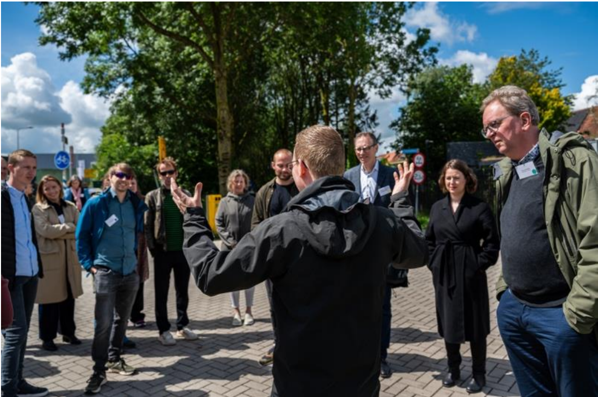
Werksessie financiële instrumenten voor klimaatadaptieve bedrijventerreinen op Lage Weide, Utrecht.

In juni 2024 organiseerde het cluster Bedrijven samen met stichting Adaptatie Atelier en het Werklandschappen van de Toekomst groeifonds programma een werksessie met banken, verzekeraars, parkmanagers en gemeenten. De verschillende publiek-private financiële instrumenten zijn besproken en beoordeeld op bruikbaarheid en schaalbaarheid, en bij elkaar gebracht in een overzicht .