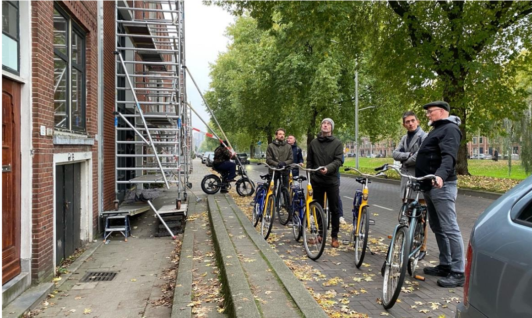
Op expeditie met de werkgroep in Bloemhof, Rotterdam. De woningen zijn verzakt ten opzichte van de straat die vroeger op dezelfde hoogte lag.